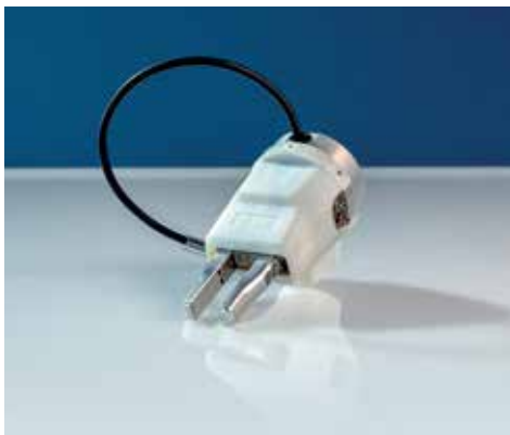
Da sinistra: soluzioni per i robot collaborativi (Plug & Play): pinza pneumatica con protezione serie JMHZ