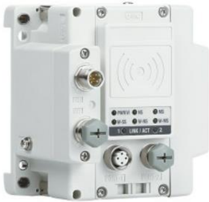
Unité sans fil SMC – Série EX600-W

À l'avenir, notre équipe de R&D travaille constamment sur la modularité du système, augmentant la vitesse des changements de préhenseur et réduisant le risque d'arrêts. Votre productivité et votre disponibilité sont nos principales priorités. Environ 50% de toutes les pinces robotisées que nous produisons actuellement sont des constructions personnalisées, ce qui souligne notre crédibilité en tant que partenaire technologique compétent et éprouvé.