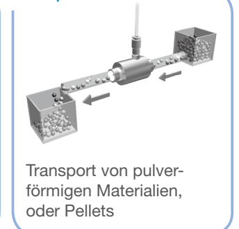
Transport von pulver- förmigen Materialien, oder Pellets