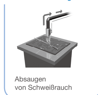
Absaugen von Schweißrauch